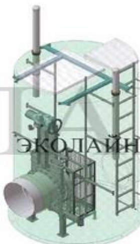
Колодец с корзиной